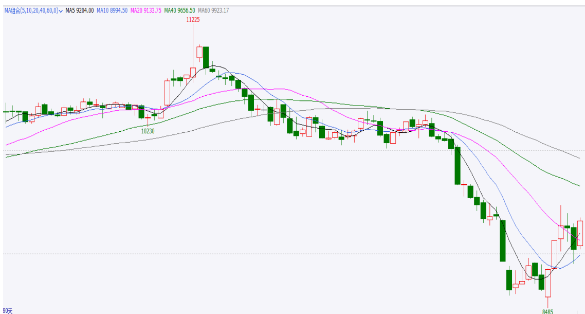
图 3 90 日期货行情走势

截止本周四，红枣期货合约 CJ109 开盘 9080，最高 9350，最低 9050，收盘 9230，，涨 240 元/吨，涨幅 2.64%，成交量增加至 122888 手，持仓量 33603 手，日增仓 2304 手。