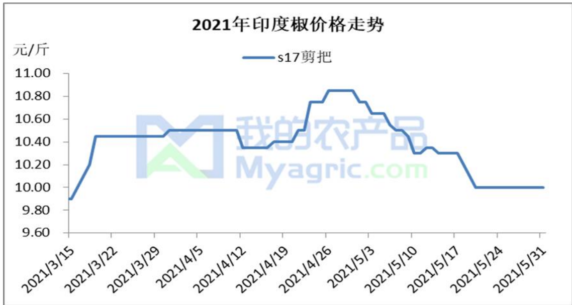
图 3 2021 年青岛印度椒价格走势

印度椒： 本月印度辣椒走货局面表现疲软，价格震荡下行。截至目前，国内印度 s17，剪把，价格 10.00 元/斤。由于进口椒存储量庞大，印度椒国内销售压力持续存在，另外终端需求不佳，客商多按需采购，多小吨位成交。部分存货商降价销售，实际成交价格混乱。