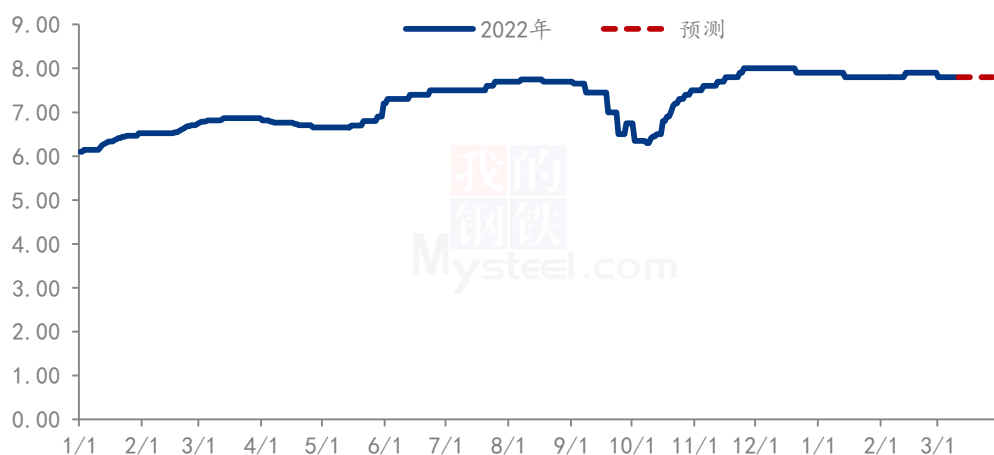
珍珠红小豆价格走势（单位：元/斤）

本周国内红小豆市场持续疲软，价格难掩下滑趋势，多数贸易商暂无采购意愿，产区部分粮商挺价意愿较强，但高价难有成交。目前三月市场需求难有提振，多数贸易商关注朝鲜进口红小豆的情形，但受公共卫生事件影响，短期内暂无进口可能。后续关注东北产区大豆的种植补贴能否抢占红小豆的种植面积，预计后期红小豆市场延续弱稳趋势运行。