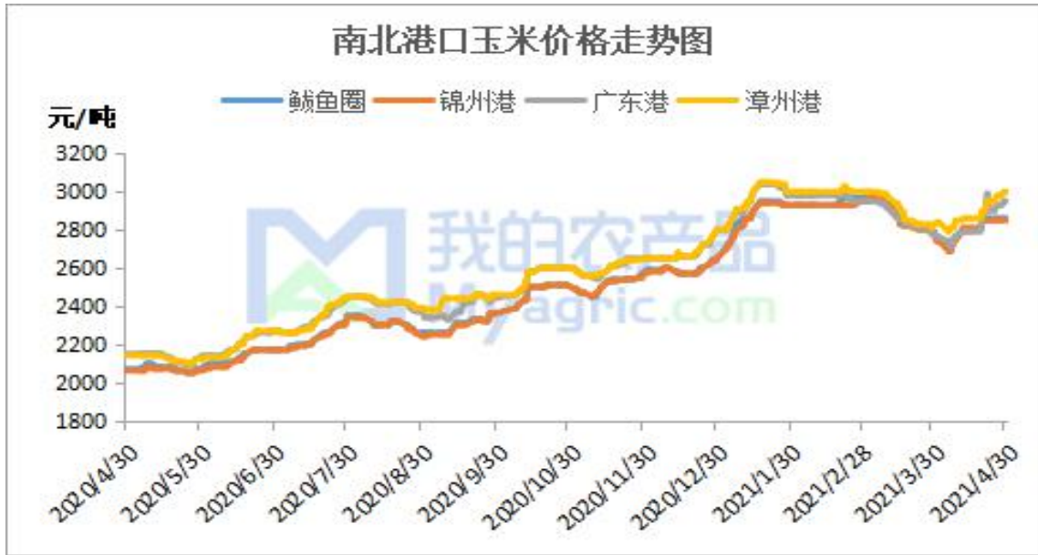
图 2 南北港口玉米价格走势

本周南北港口玉米价格稳中有涨。北方港口玉米到货量仍偏低，近期期货上涨，提振港口贸易商收购心态。截止至 5 月 13 日，北方港口二等玉米收购价格 2820 元/吨，较上周上涨 20 元/吨。目前南北港口玉米贸易已经顺价，北方港口收购主体逐渐增加，港口发运需求有所改善。南方销区内贸玉米库存已降至低位，加上内贸玉米价差持续缩小，饲料企业部分刚性需求释放，对玉米价格构成支撑。预计短期内玉米价格稳中偏强运行为主。