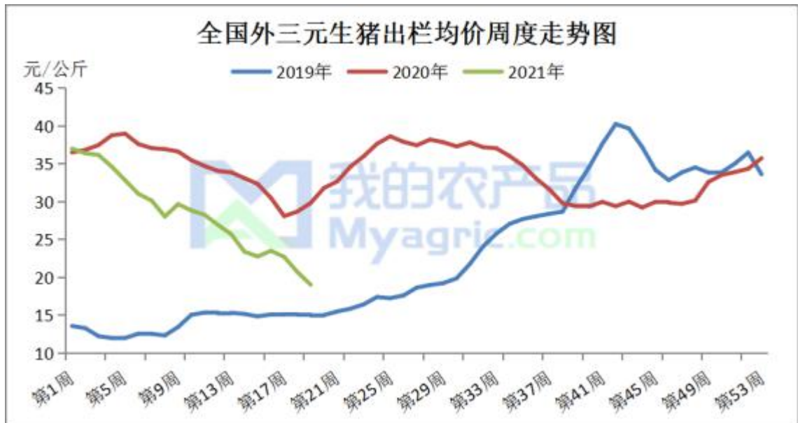
图 6 生猪价格走势

本周生猪出栏均价 19.01 元/公斤，较上周下跌 1.67 元/公斤，环比-8.08%，同比-36.23%。近日猪价涨跌调整，北方小幅反弹，南方仍有补跌；虽散户有所抗价，但整体效果一般，猪价反弹动力不足。当前市场大猪占比仍高，终端消费不旺，加之疫病担忧出栏不减；猪价缺乏有效支撑，预计短期弱稳为主。