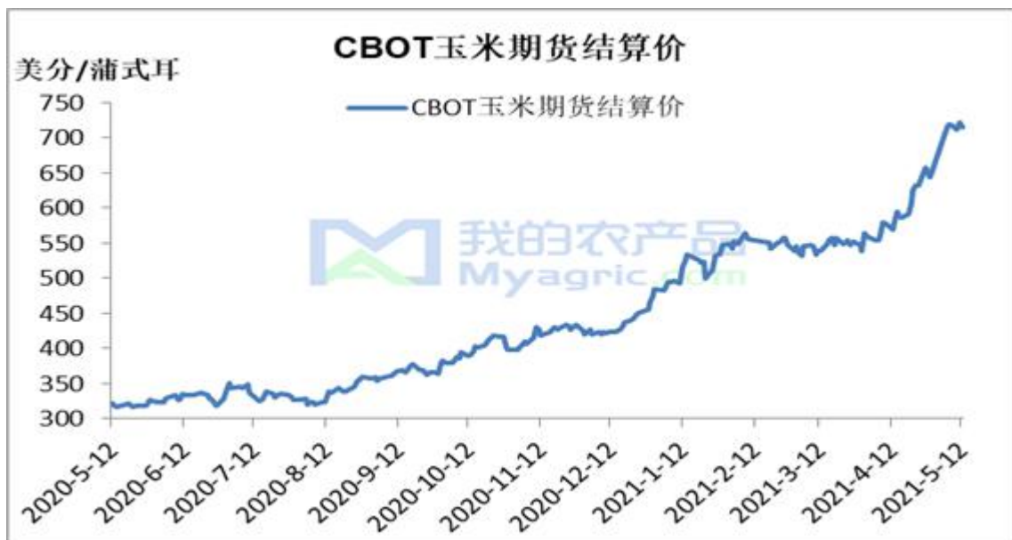
图 4 美盘玉米期货价格走势

本周 CBOT 玉米期货合约 6 日结算价为 718.75 美分/蒲式耳，本周最高价为 722.25 美分/蒲式耳，最低价为 714.75 美分/蒲式耳，盘面差价为 7.50 美分/蒲式耳。基本面关注美国农业部供需报告结果，以及南美玉米市场生长情况及供应预期。