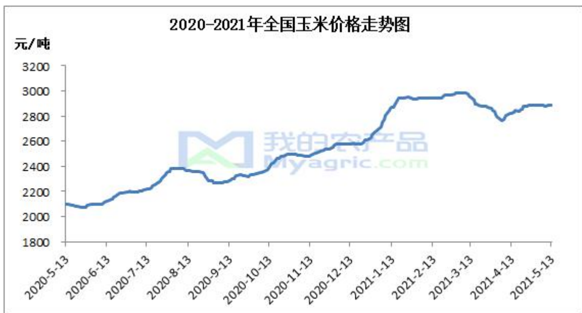
图 1 国内玉米价格走势

本周东北地区玉米价格稳定运行。东北地区玉米购销活动较为清淡，华北小麦倒流至东北替代饲料玉米消费，深加工企业库存整体充裕，不过当地中储粮高价开仓收粮对玉米价格有所提振。深加工厂门到货车辆较少，目前主要以消化库存为主，个别仍有收购需求企业小幅上调收购价格。截止至 5 月 8 日，哈尔滨玉米市场价格为 2700 元/吨，较上周持平；长春地区玉米市场价格为 2730 元/吨，较上周持平。