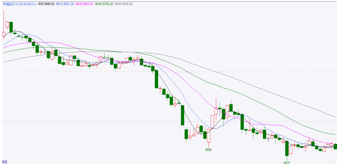
图 3 90 日期货行情走势

截止本周四，红枣期货合约 CJ109 开盘 8555，最高 8580，最低 8425，收盘 8450，涨-45 元/吨，涨幅-0.53%，成交量 54838 手，持仓量 54226 手，日增仓 1179 手。