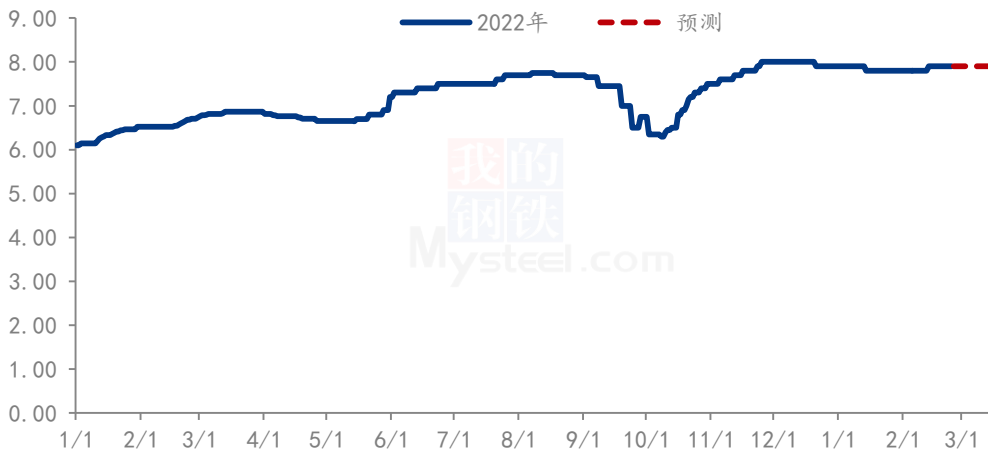
珍珠红小豆价格走势（单位：元/斤）

本周红小豆市场平稳为主，短期内难有波动。目前各品种商家按质定价，不同地区略有差价，目前下游市场要货不多，需求有限，抵触高价货源，粮商等待三月至四月食品厂需求情况，预计红小豆短期内维持目前趋势，僵持为主。