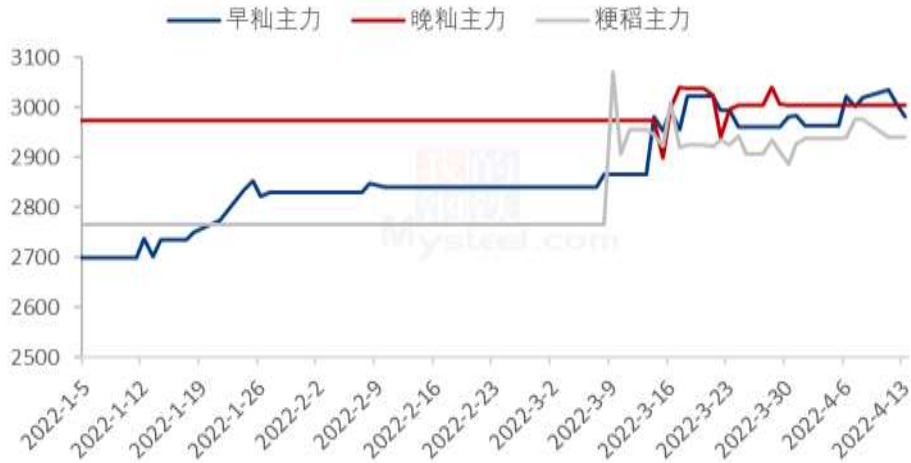
2022年国内稻谷期货价格走势（单位：元/吨）

晚籼主力合约与粳稻主力合约未开盘。（备注：郑商所早籼稻、晚籼稻和粳稻当日未开盘情况，延续上一开盘日的收盘价作图）