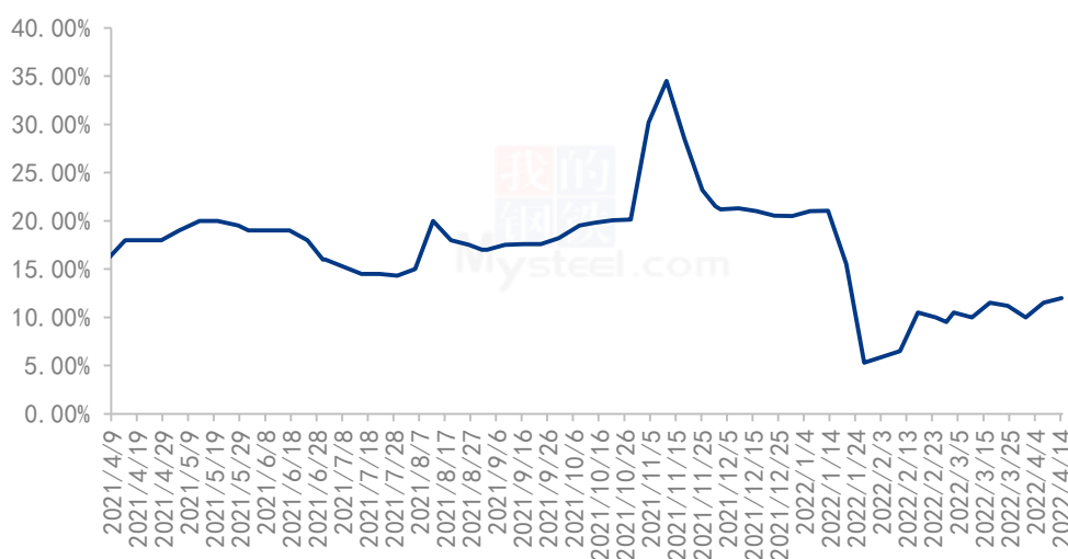
2022 年全国米厂平均开机率

本周全国米厂平均开工率 12%左右，开机率上调 0.5%，小部分地区陆续恢复生产，预计下周开机率仍将小幅提升。