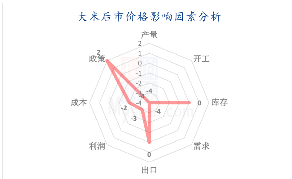
图 6 稻米后市价格影响因素分析