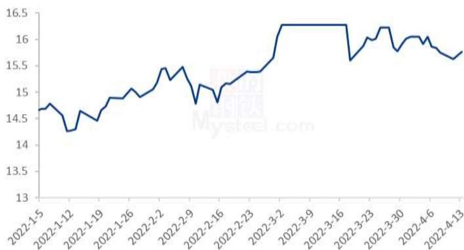
2022年CBOT糙米价格走势（单位：美元/英担）

截至 4 月 13 日 CBOT 糙米主力合约收盘价 15.765 美元/英担，环比上周四下跌 0.1 美元/英担。