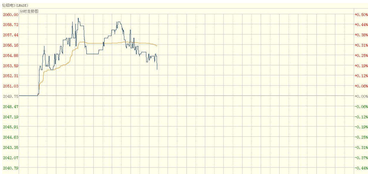
图四 LME3_铝分时走势图（亚洲时段）