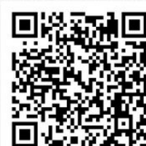
(期、现货铝交易微信)