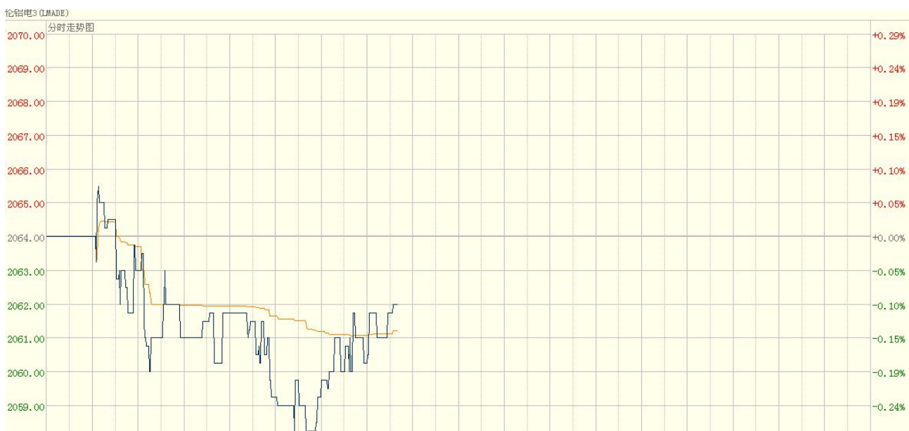
图四 LME3-铝分时走势图（亚洲时段）