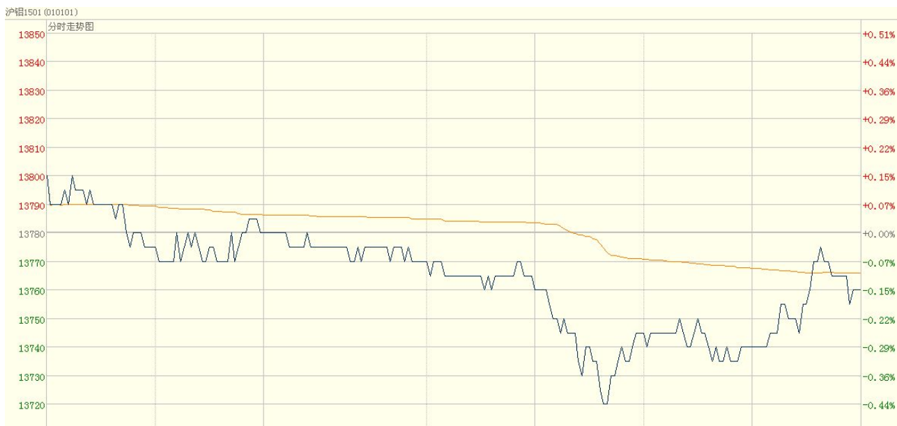
图一 电解铝主力合约（1501）分时图