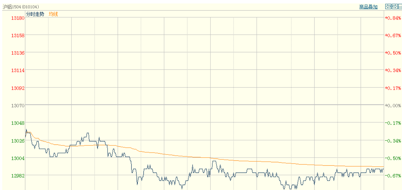
图一 电解铝主力合约（1504）分时图