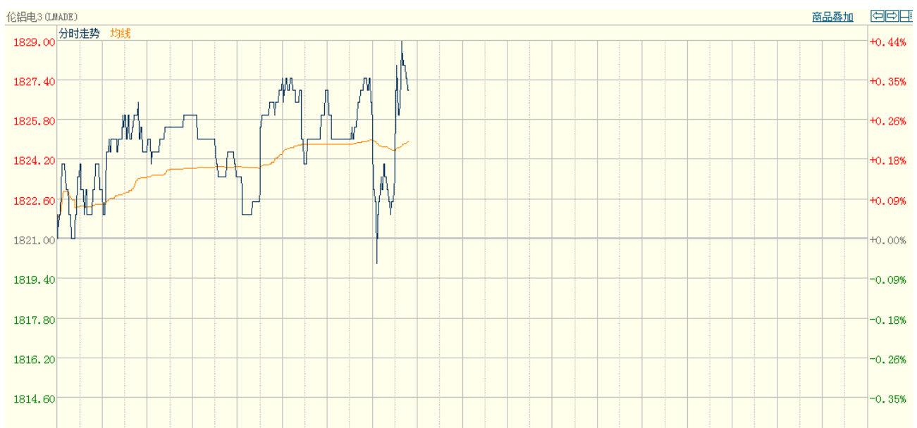
图二 LME3 铝亚洲时段分时图