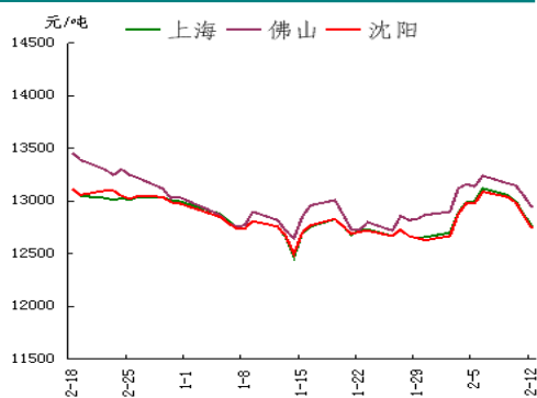
电解铝三地均价走势图