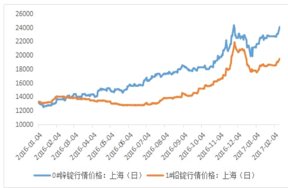
铅锌主流地区期货库存