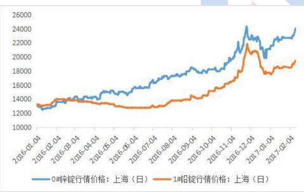
铅锌主流地区期货库存