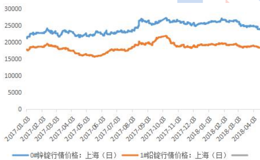
铅锌主流地区期货库存图