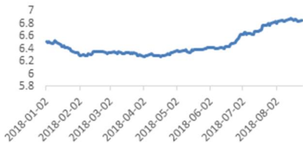
美元兑人民币价格走势