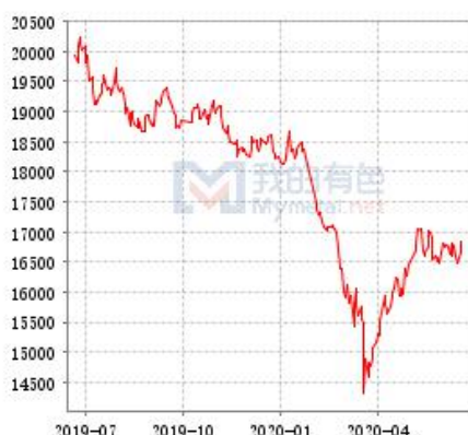
锌 SHFE 与 LME 库存走势图