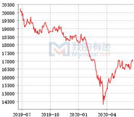
锌 SHFE 与 LME 库存走势图