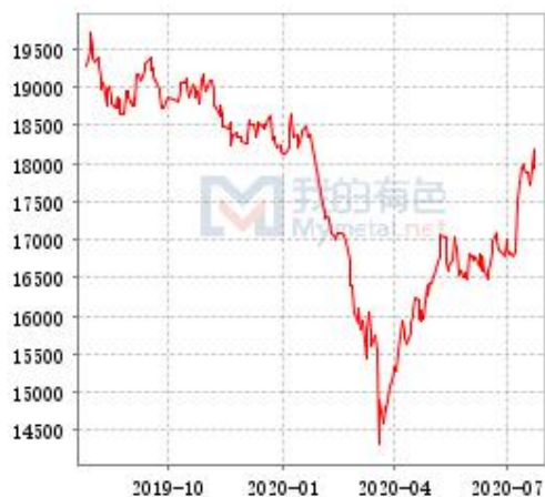
锌 SHFE 锌锭库存走势图