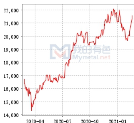
锌 SHFE 与 LME 锌锭库存走势图