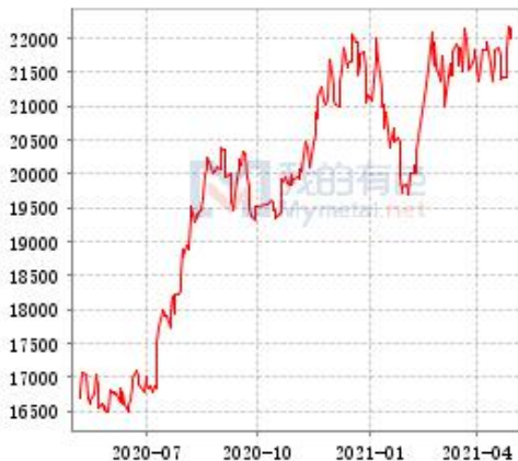
锌 SHFE 与 LME 锌锭库存走势图